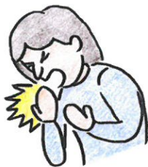
喘息や慢性の咳がある