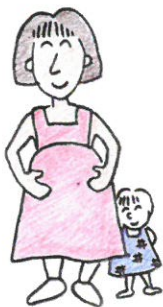
妊娠・出産経験がある