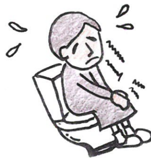
便秘傾向が強く、排便時に力むことが多い